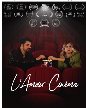
Productions : Baptiste Crépin / Curtiz Bay